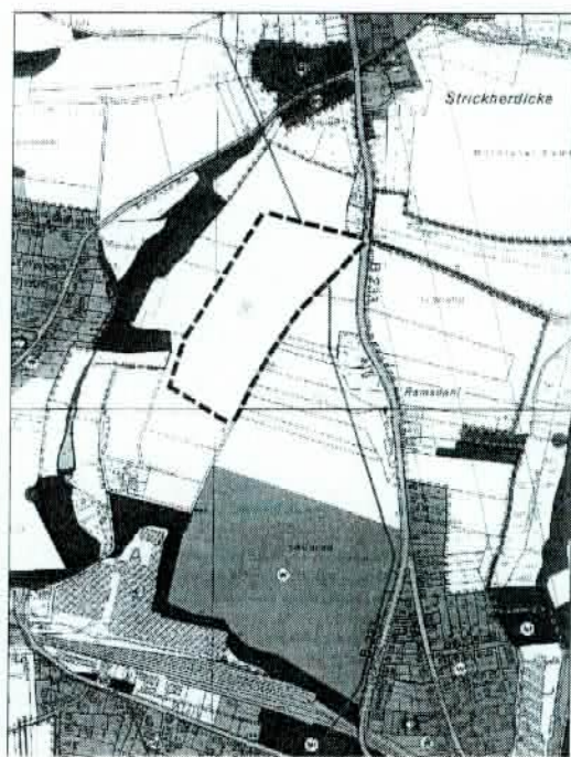
1. Änderung des Flächennutzungsplans ohne Maßstab

Es handelt sich hierbei um eine ca. 6 ha große Fläche, die in folgenden Gemarkungen liegt: